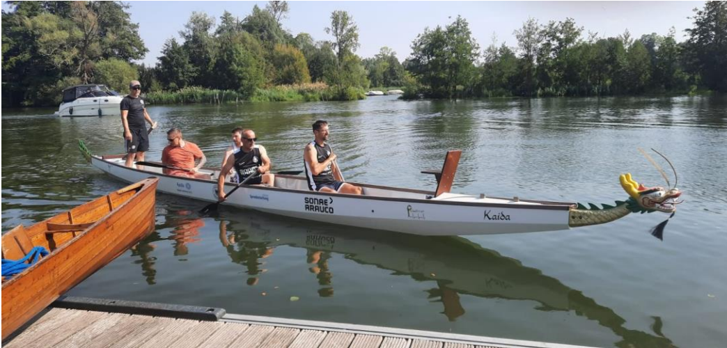
Bildunterschrift: Begrüßung des neuen Drachenbootes „Kaída“ (kleine Drachin).