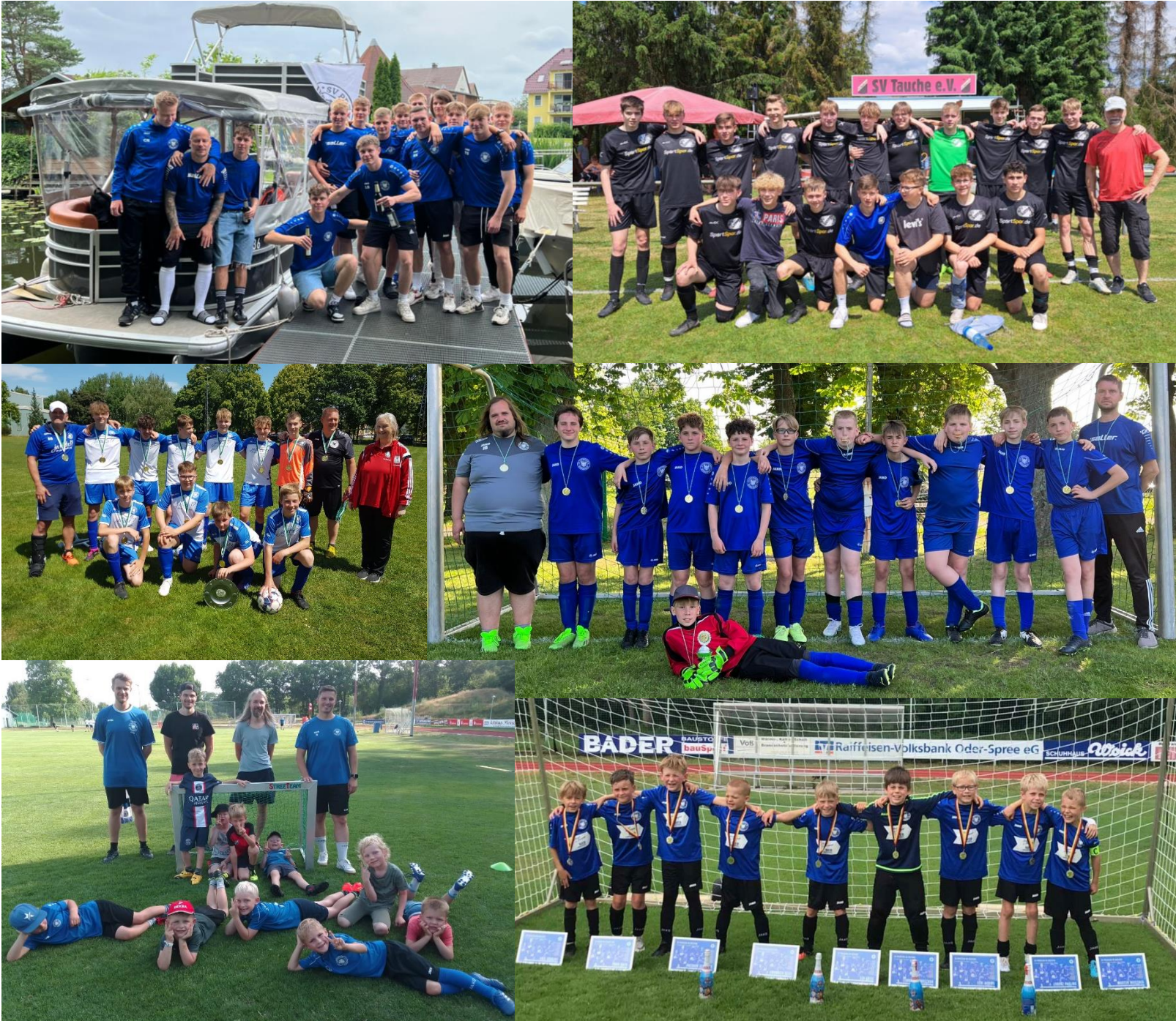
Bildunterschrift: Von oben links nach unten rechts, A-Junioren, B-Junioren, C-Junioren, D-Junioren, Bambinis, F1-Junioren