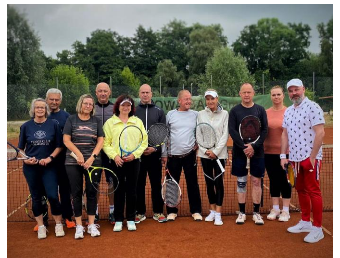
Bildunterschrift: Gruppenbild aller Teilnehmer

Am Samstag (17.6.23) fand unser erstes Tennisturnier statt. Es war ein kleines sogenanntes Schleifchenturnier. Für jeden Sieg erhielt das jeweilige Doppel-Team eine Schleife und das Team mit den meisten gewonnenen Schleifen wurde zum Sieger des Turniers gekürt. Das Teilnehmerfeld war bunt gemischt und bestand aus 14 Frauen und Männern aus dem eigenen und aus einem befreundeten Tennisverein aus Frankfurt/Oder.