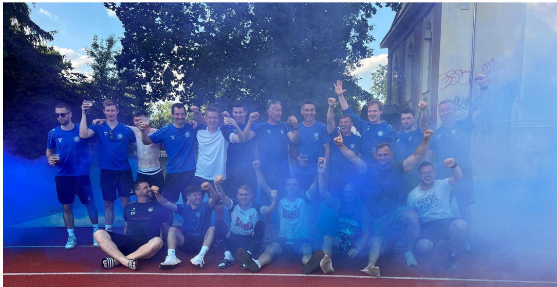
Bildunterschrift: Unsere Herrenmannschaft des SV Preußen 90 Beeskow e.V. verabschieden sich aus der Landesklasse