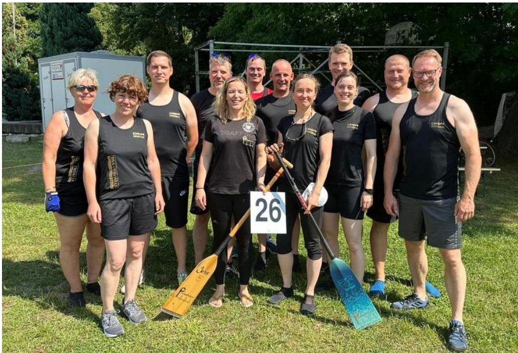
Bildunterschrift: Unser Team bei der Regatta