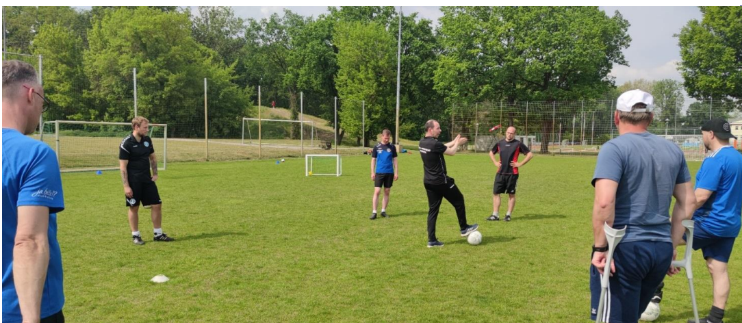
Bildunterschrift: Trainerweiterbildungsgruppe im praktischen Teil auf dem SFZ Beeskow